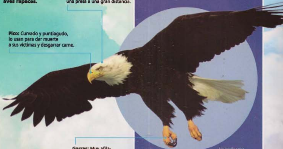
Un águila calva durante el vuelo.